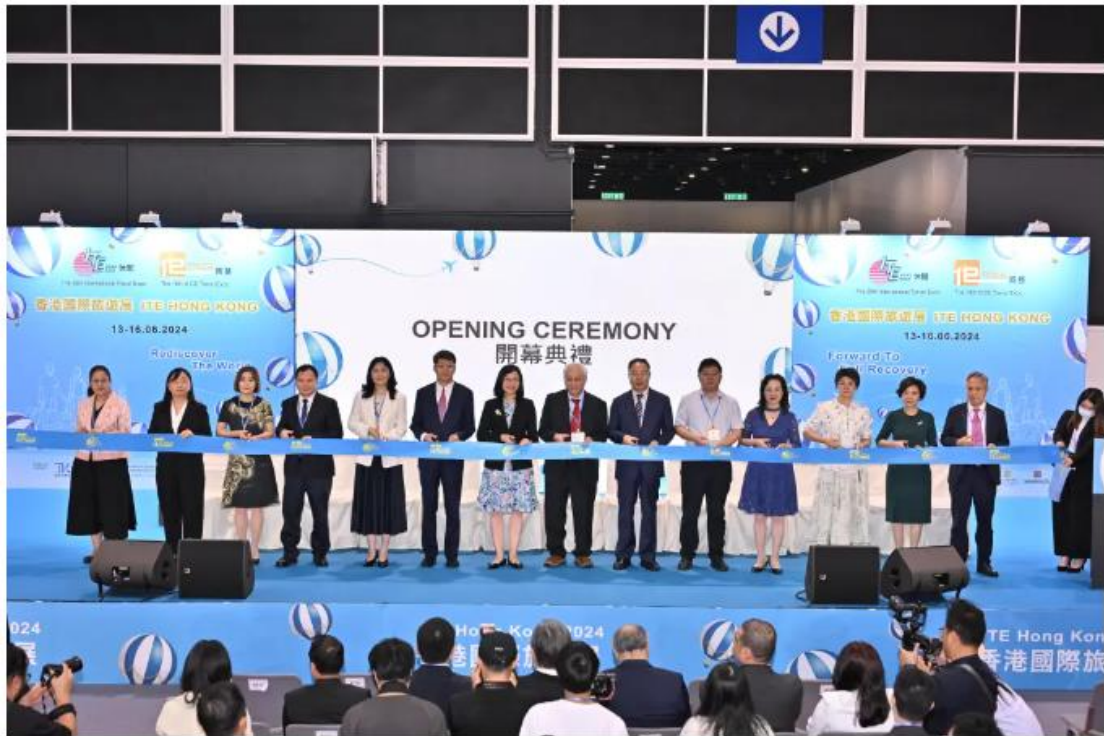
香港国际旅游展开幕剪彩仪式