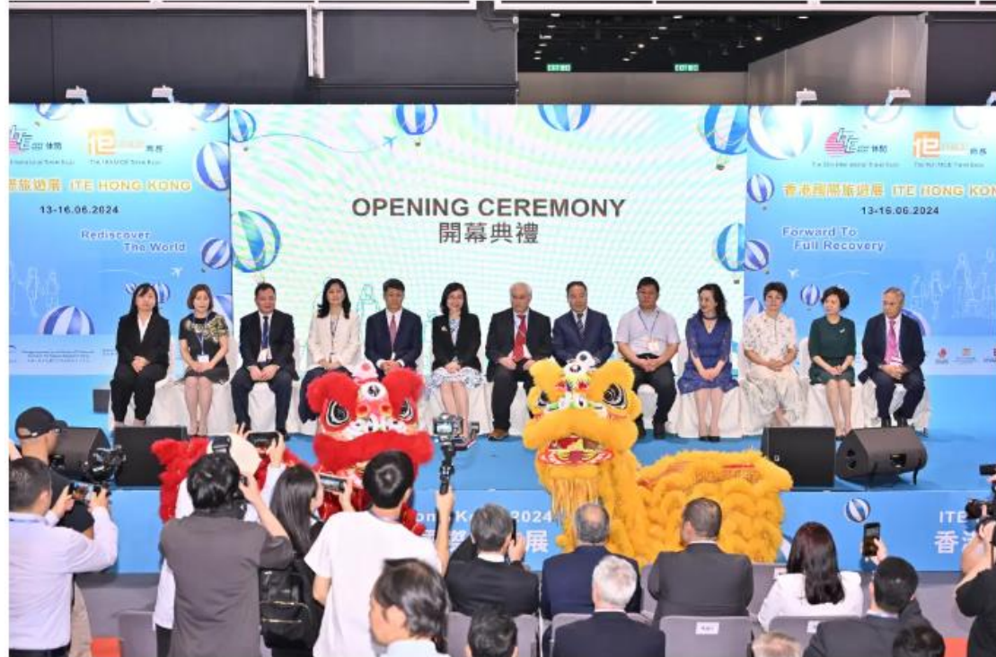
香港国际旅游展开幕式