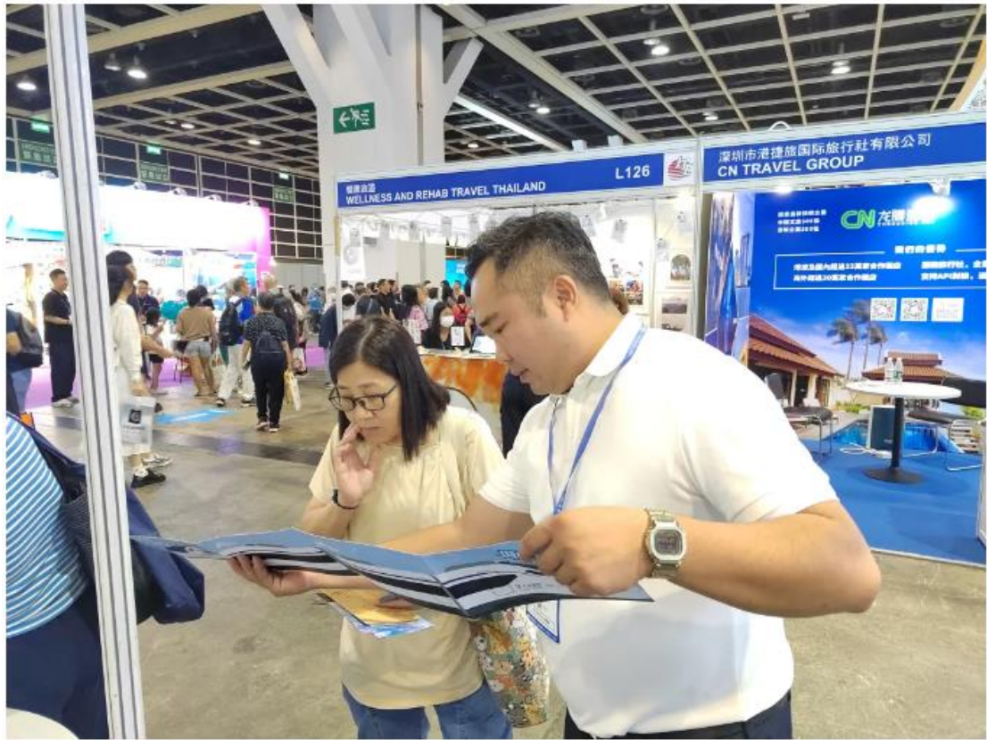
参展商耐心向市民介绍广东城际沿线旅游资源