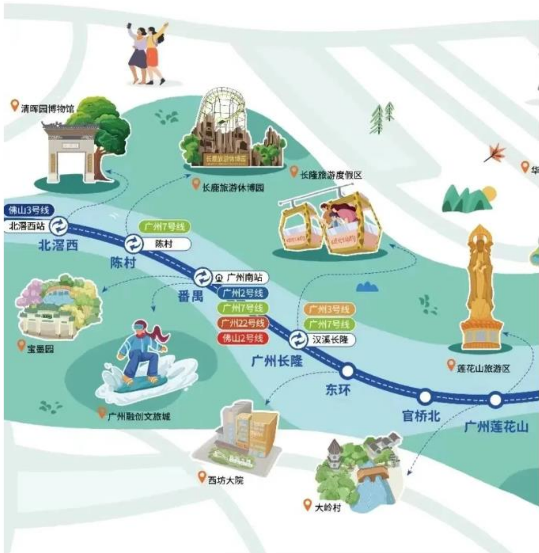
番禺城际线路游玩地图