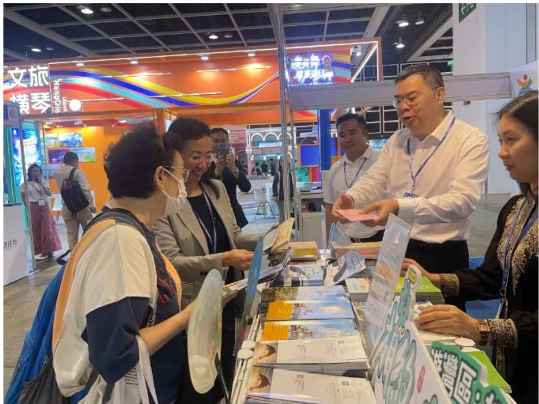
市民积极了解广东城际铁路沿路景点