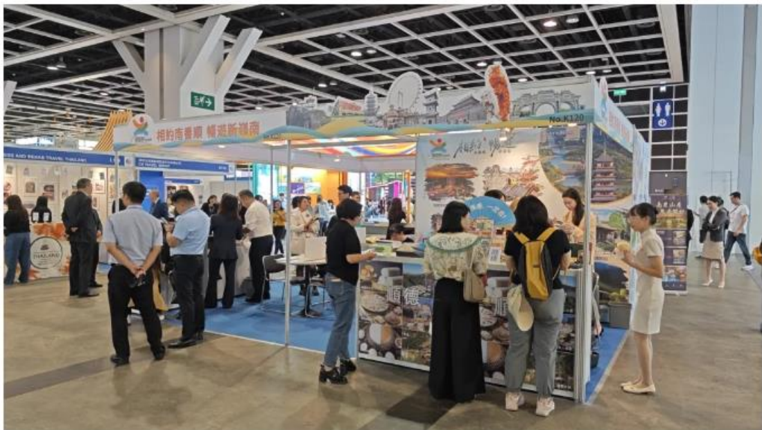
南番顺旅游联盟展位前人潮汹涌

今年5月，番禺区文化广电旅游体育局与广东城际铁路运营有限公司签订战略合作框架协议，开启“ 旅游+交通 ”战略合作，依托佛肇、莞惠、广佛南环、佛莞城际等轨道交通网络，开展宣传推广、活动策划、场地建设等系列合作，构建一体化旅游交通网络，促进番禺区和周边旅游资源的互联互通。通过此次在香港国际展上的进一步宣传推广，将带动更多香港市民到番禺旅游，进一步促进粤港澳大湾区全域旅游的发展。