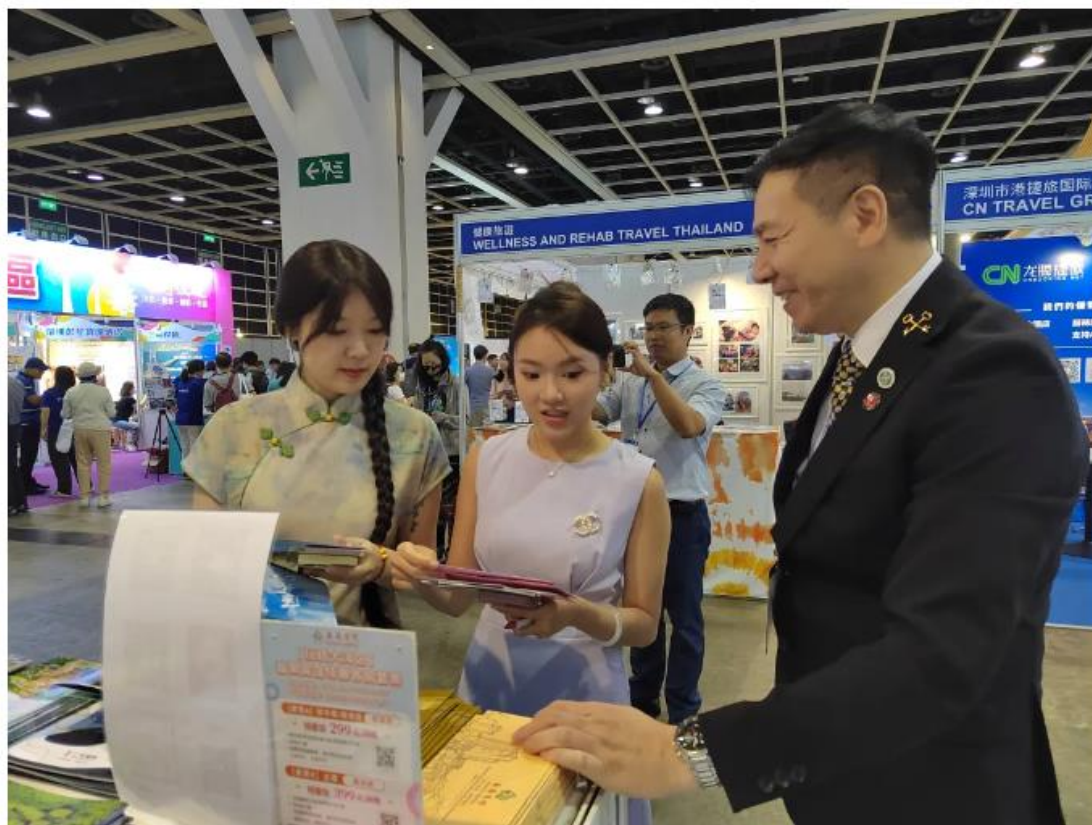
向香港市民介绍番禺特色景点