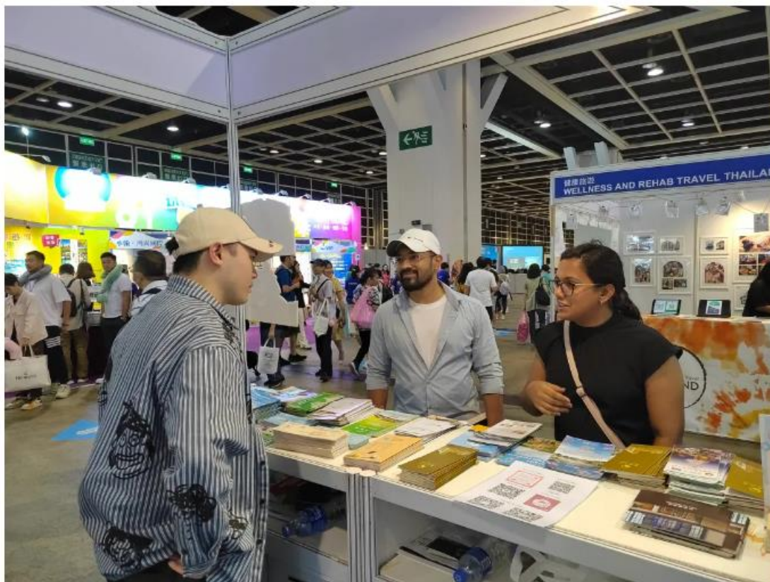
向国际友人介绍番禺特色景点